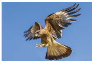
Tiuque: Milvago chimango