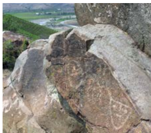
Motivo cabeza triangular