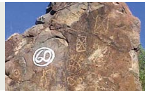
3 "Signo Escudo"