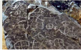
6 Figuras zoomorfas y círculos cuatripartitos