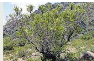
Olivillo: Kageneckia angustifolia