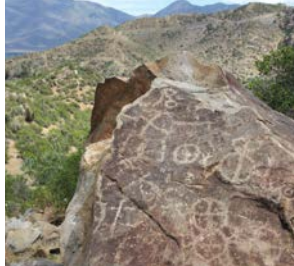
Figuras circulares complejas o simple

La técnica de elaboración utilizada para los petroglifos fue el grabado, a través de la percusión y el raspado. Algunos de los motivos más representativos.