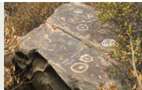
2 Círculos con punto central