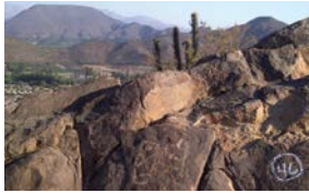
5 "Signo Escudo"