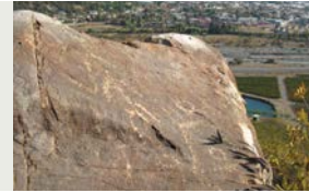
8 "Hombre espiga"