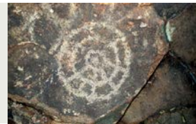
4 Círculos concéntricos con líneas radiales