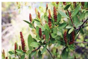
Colliguay: Colliguaja odorifera