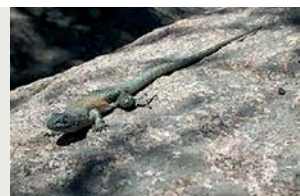
Lagartija Nítida: Liolaemus nitidus