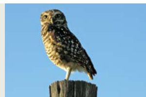
Pequén: Athene cucularia cucularia