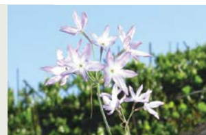
Huilli: Leucocoryne ixiooides