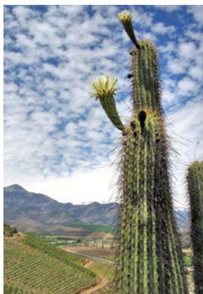
Cactus: Trichocereus chilensis