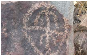
1 Círculo con cruz diametral y figura central