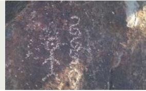
7 Figura humana